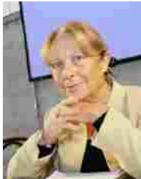
Silvia Vegetti Finzi

Premetto che per essere tale una bugia deve presumere l'intenzione di mentire , ma questa consapevolezza richiede un'evoluzione psichica piuttosto complessa che dobbiamo conoscere per non accusare e punire ingiustamente i bambini per colpe che non sono in grado di comprendere.